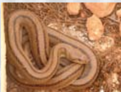
culebra de escalera

El recorrido de este sendero comienza junto a la fuente de la ermita de San Antón (UTM 30 S 0623931-4359765) y enseguida nos encontraremos caminando por un trazado sinuoso entre olivos centenarios